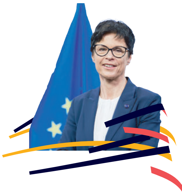
MARTA KOS KOMMISSARIN FÜR ERWEITERUNG

Allen, die diese Mission in die Welt getragen haben, sage ich: Danke. Seit drei Jahrzehnten helfen Sie dabei, Länder zu transformieren und Leben zu verbessern. Sie verkörpern die europäische Solidarität. Angesichts der globalen Umbrüche, die unsere Welt neu gestalten, werden wir Sie mehr denn je brauchen, um ein stärkeres, sichereres Europa aufzubauen, in dem bessere Institutionen auch weiterhin ein besseres Leben ermöglichen.